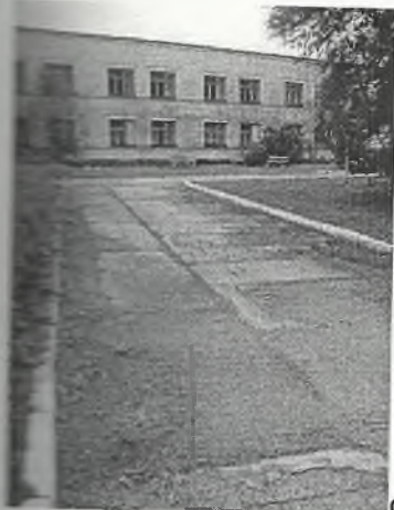
Φοτο Νο 1-9