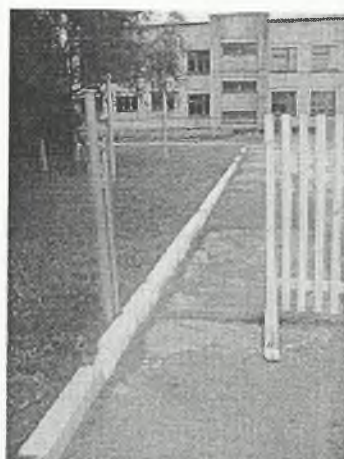
Φοτο Νο 1-4