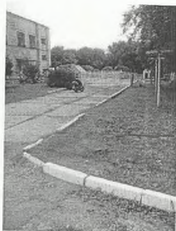
Φοτο Νο 1-10