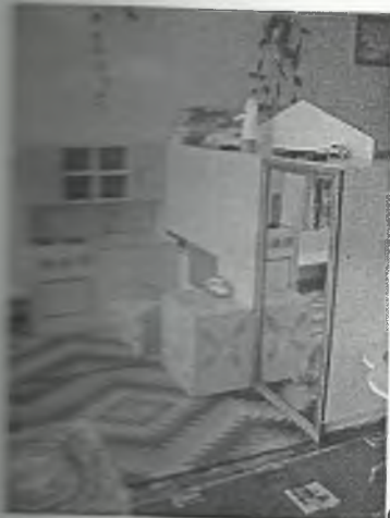
φωτο Νο 4-3