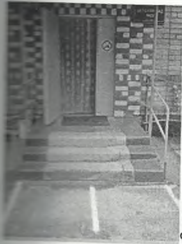
Φοτο Νο 2-1