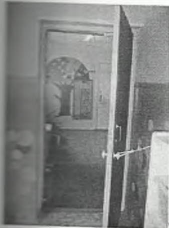
Φοτο Νο 2-5