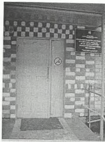
Φοτο Νο 2-2