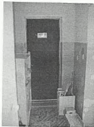
Φοτο Νο 2-6