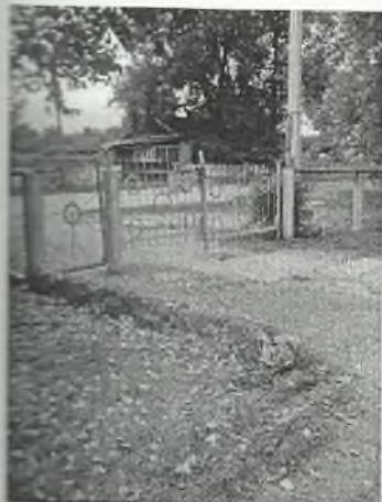
Φοτο Νο 1-1