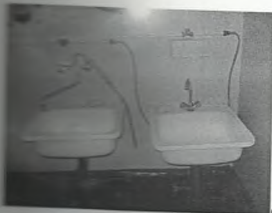
φωτο Νο 5-3