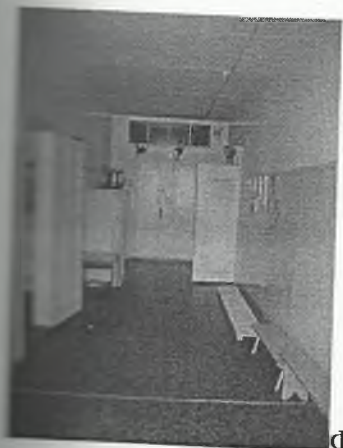
Φοτο Νο 3-1