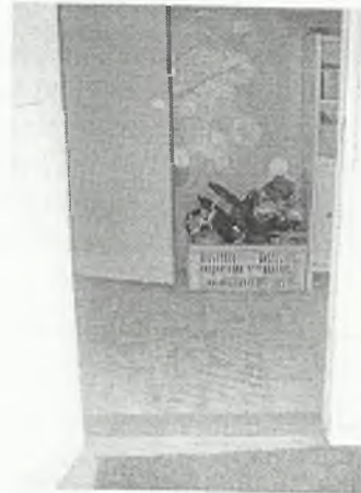
Φοτο Νο 2-4