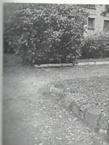
Φοτο Νο 1-5