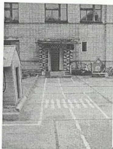
Φοτο Νο 1-14