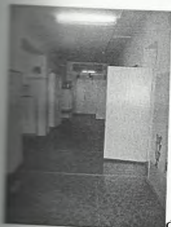
Φοτο Νο 3-3