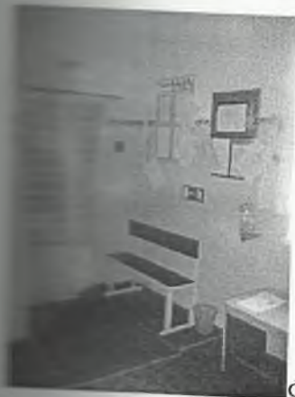
Φοτο Νο 3-7