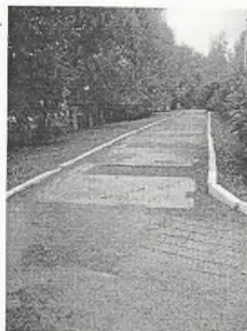
Φοτο Νο 1-6