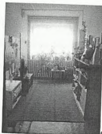
Φοτο Νο 3-2