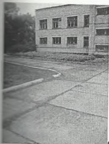
Φοτο Νο 1-11