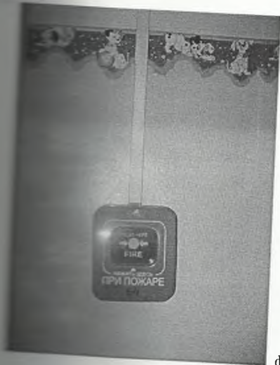
φωτο Νο 6-3