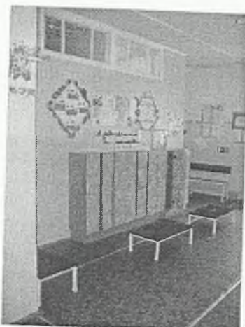
Φοτο Νο 3-6