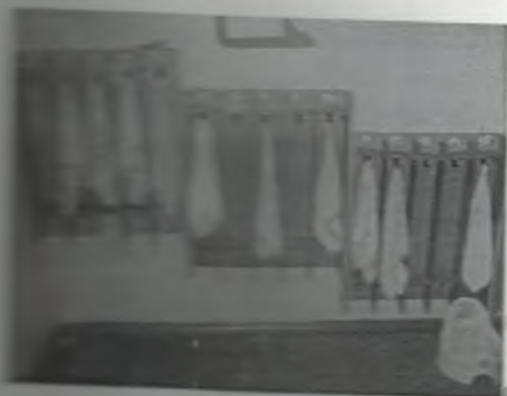
φωτο Νο 5-4