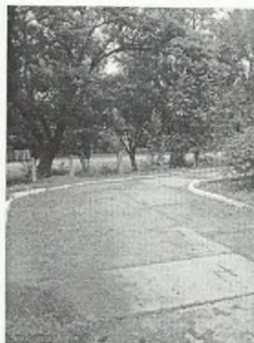
Φοτο Νο 1-8