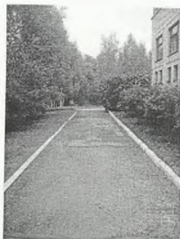
Φοτο Νο 1-12