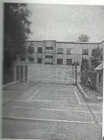
Φοτο Νο 1-13