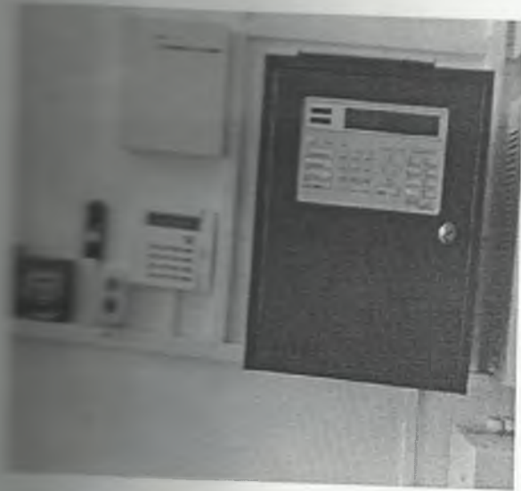
φωτο Νο 6-2