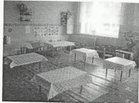
φωτο Νο 4-2