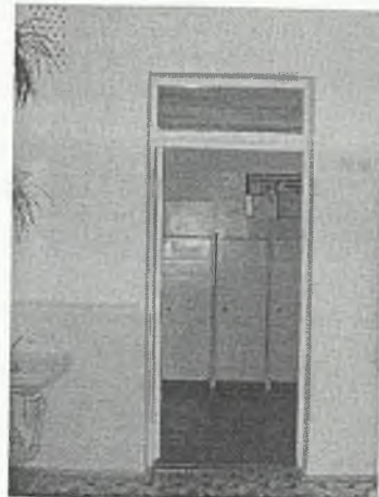
φωτο Νο 4-6