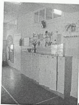
Φοτο Νο 3-4