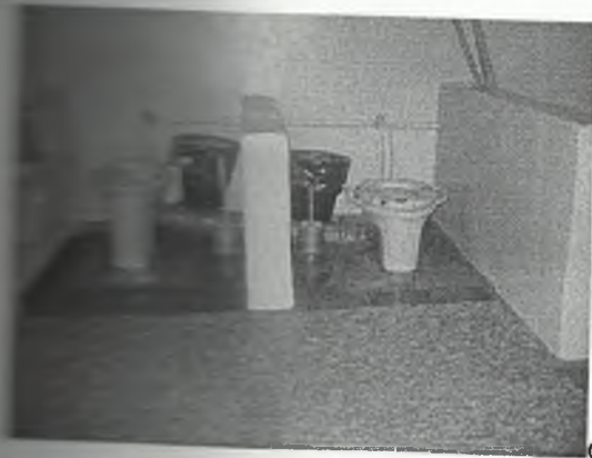
φωτο Νο 5-1