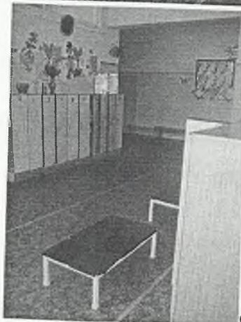
Φοτο Νο 3-8