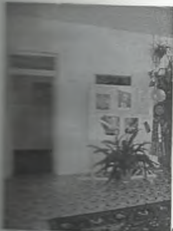
φωτο Νο 4-5