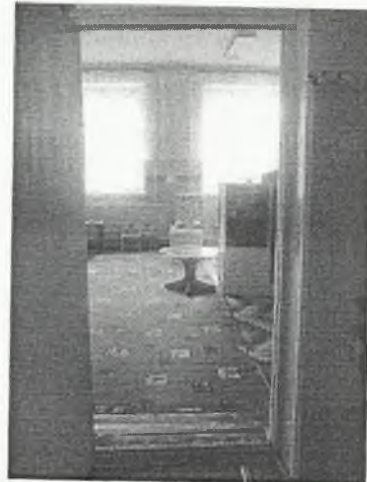
φωτο Νο 4-4