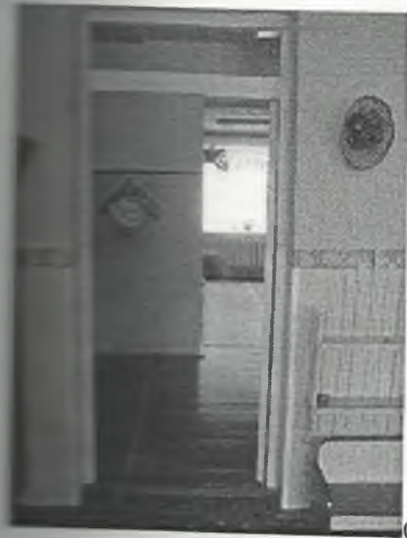
φωτο Νο 4-1