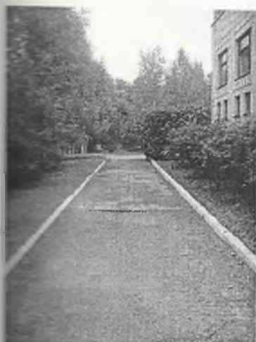
Φοτο Νο 1-7