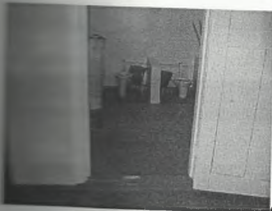
φωτο Νο 5-2