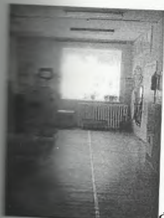
Φοτο Νο 3-5