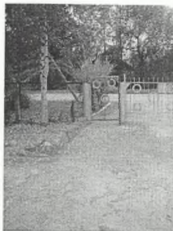
Φοτο Νο 1-2