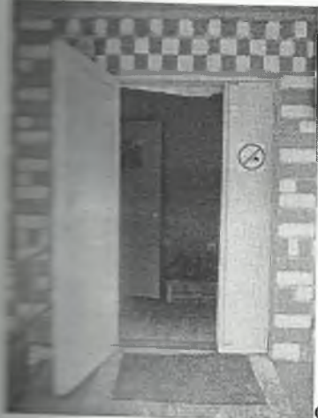
Φοτο Νο 2-3