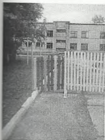
Φοτο Νο 1-3